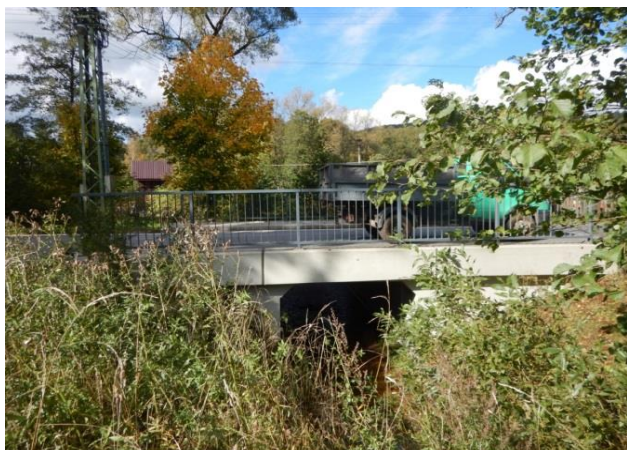
Kritický bod - most přes Malou Jeřici

Místo na dolním konci toku Malé Jeřice nedaleko jejího ústí do Jeřice. Nekapacitní mostek přes silnici způsobuje vzdouvání a rozliv k domům na pravé straně toku. KB převzat z POVISu, jedná se však již spíše o místo ohrožené říčními povodněmi.