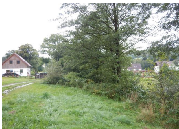
Zahloubené koryto nad KB, vpravo ohrožená zástavba